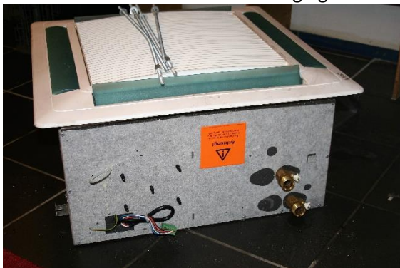
Losgekoppelde unit van de winkel