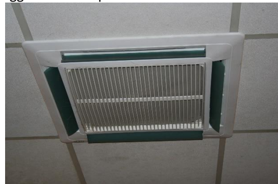
2 de Koel/verwarmingsunit ingebouwd in systeemplafond magazijn