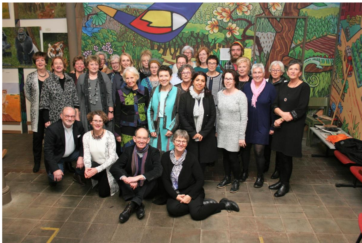
Teamfoto genomen tijdens onze Nieuwjaarsbijeenkomst (15 januari 2017) in het Wereldpaviljoen in Steyl.

Wij danken alle in 2016 betrokken en vertrokken medewerkers voor hun inzet.