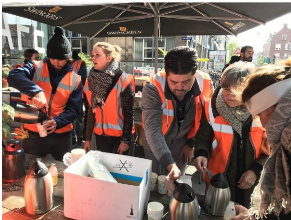
11 uur, koffiepauze op het terras van Grenswerk.