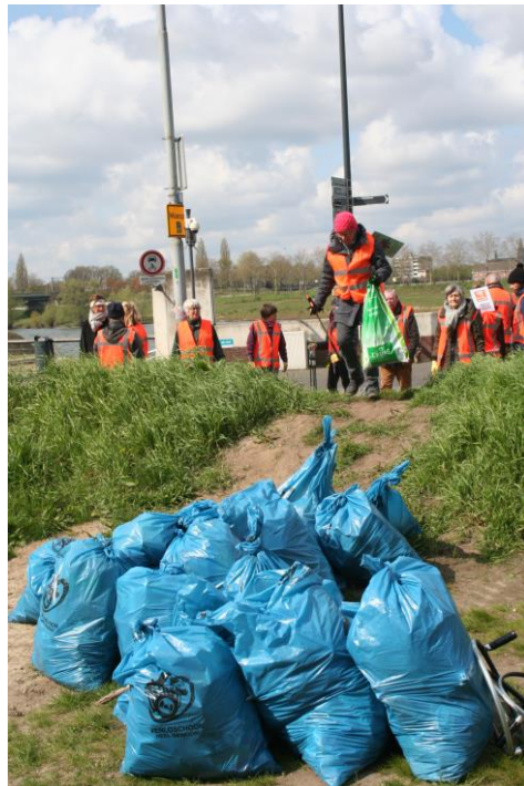
Anderen hebben weggegooid wat wij hebben verzameld.