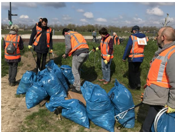
De gemeente haalt het verzamelde zwerfvuil op.