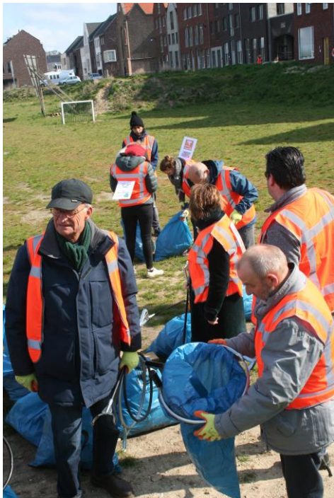
Alle zakken worden verzameld.