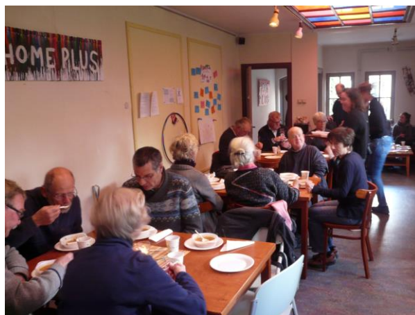
Na afloop een heerlijke lunch samen in Home +.