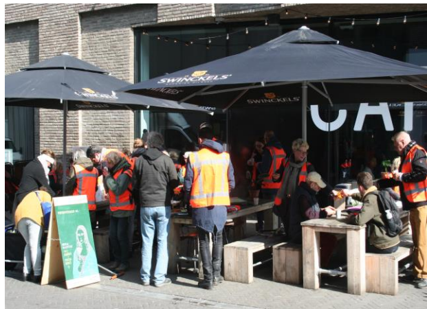
Het terras bij Grenswerk.