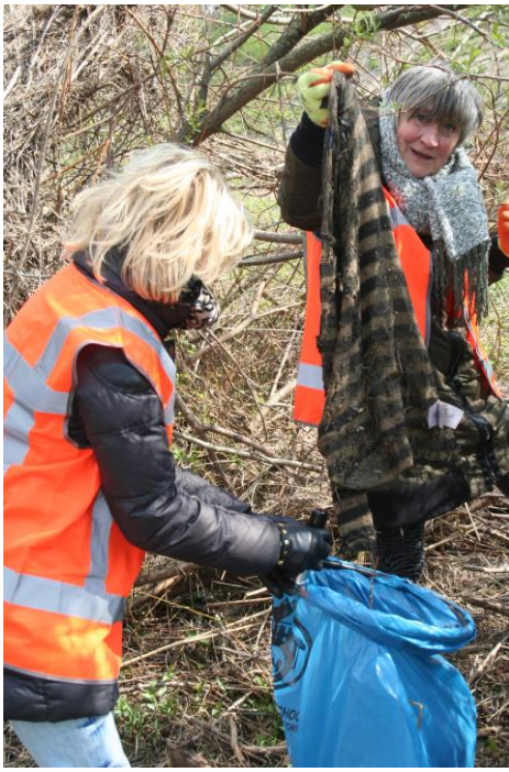
Er ligt van alles