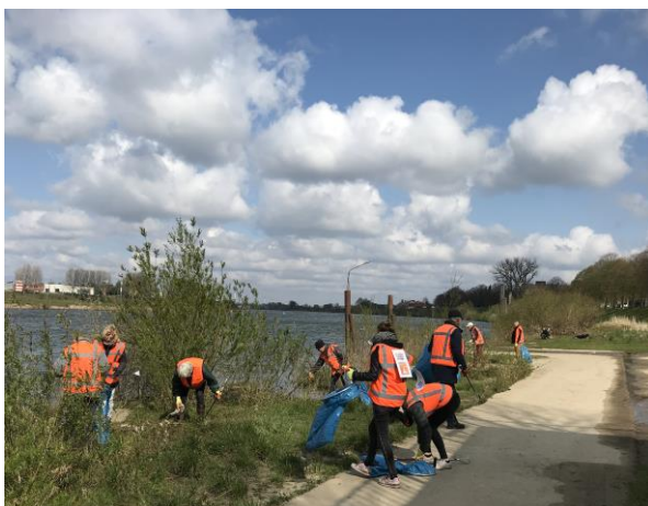
Langs de Maas is altijd veel zwerfvuil te vinden.