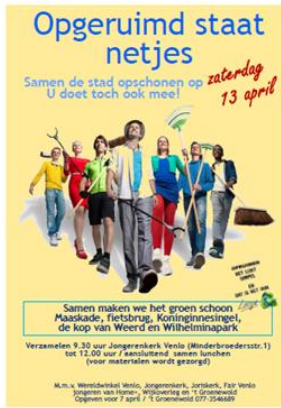
Foto-impressie Schoonmaakactie "OPGERUIMD STAAT NETJES!" (1 van 3)