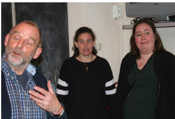
Catering verzorgd door deze twee geweldige dames.