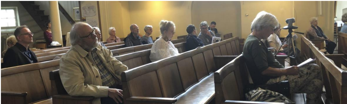
Een gemêleerd gezelschap met (oud) vrijwilligers, sponsoren van de Refresh, partners van het Global Goals Platform, Fairtrade gemeente Krefeld, Wereldwinkel Tegelen, Ondernemers Gasthuisstraat, en voorzitter Venlostad.com klaar voor de verschillende presentaties en intermezzo's