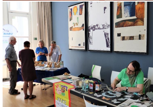
Lebendige Erde Krefeld e.V.: Solidarische Landwirtschaft in Krefeld