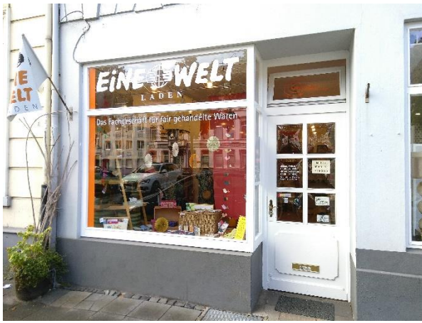
Foto Impressie fietstocht Nachhaltigkeitstag Volkshochschule Krefeld 17 juni 2023