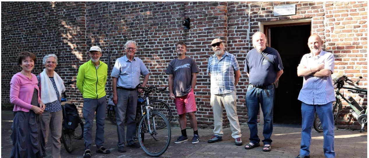
Foto Impressie fietstocht Nachhaltigkeitstag Volkshochschule Krefeld 17 juni 2023