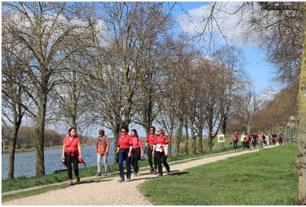
De laatste loodjes op de dijk