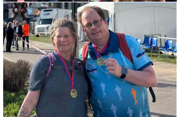
Ook voor Wereldwinkel Diana en haar wandelmaatje