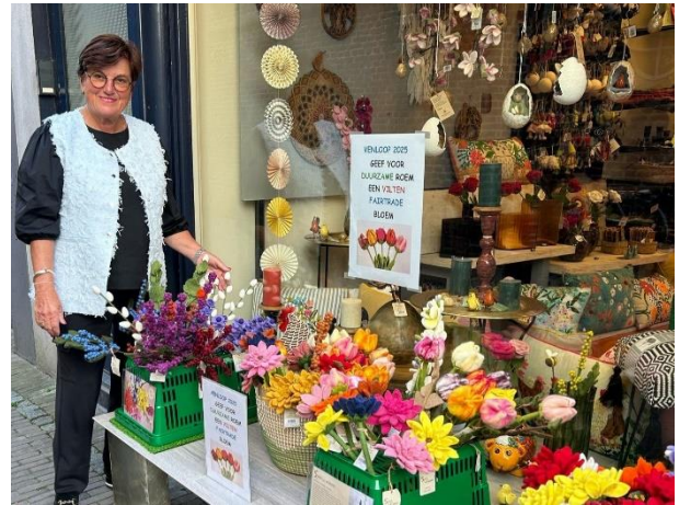
Om de hoek bij de Joriskerk is vóór de Wereldwinkel een viltten bloemenkraam ingericht