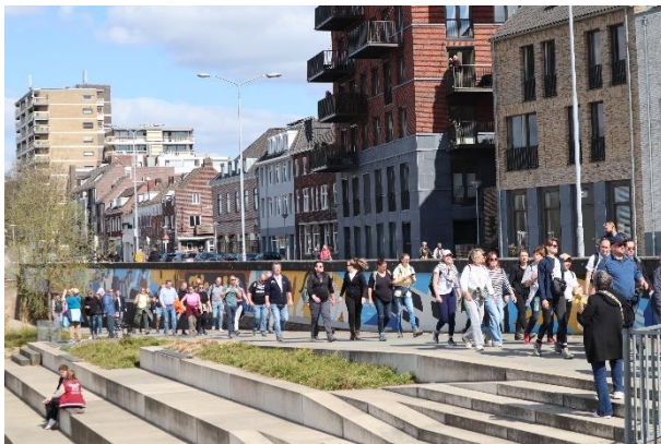
Welcomspersussie door Guns en Roses