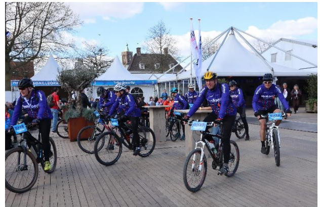
Tijd voor welverdiende rust of op de fiets naar huis. Duurzame fairtrade roem iets voor jou in 2026?