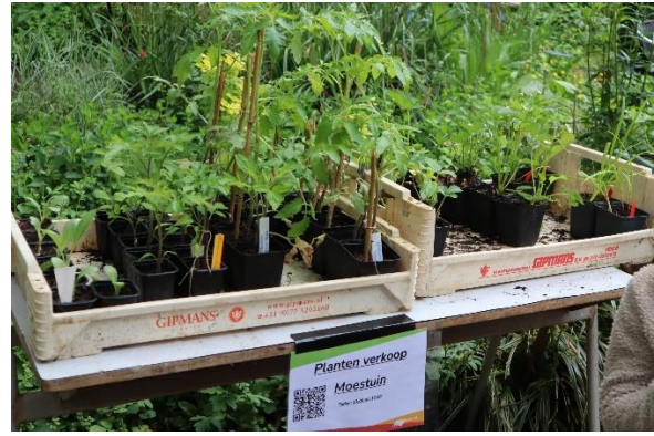
Naast de moestuin bewonderen kun je er vandaag ook kruiden- en groenteplantjes kopen