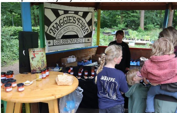
Maggie van Maggie's Farm heeft zelf gemaakte jams en chutneys van producten uit eigen tuin.