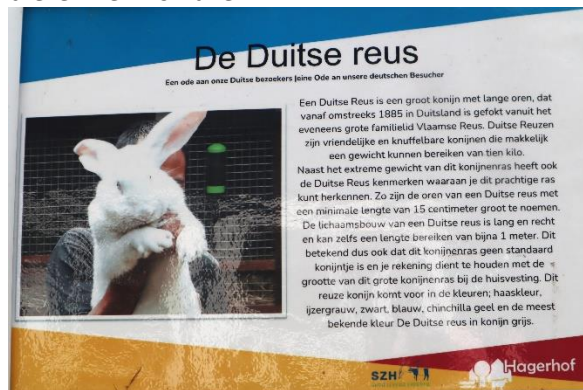
Zoals de Duitse reus