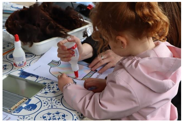
Bij het knutselen wordt ingespeeld op het thema wol door kleurplaten in te kleuren en van plukjes wol te voorzien