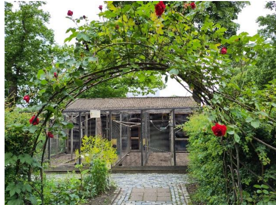
Rechts voor het restaurant kom je langs een mooie rozenboog en kun je met verschillende dieren kennismaken.