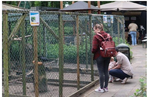
En de Hollandse krielkip