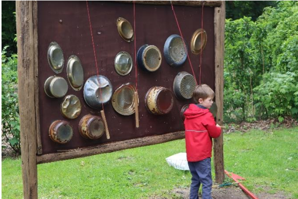
Op het veldje zijn ook de vaste attracties