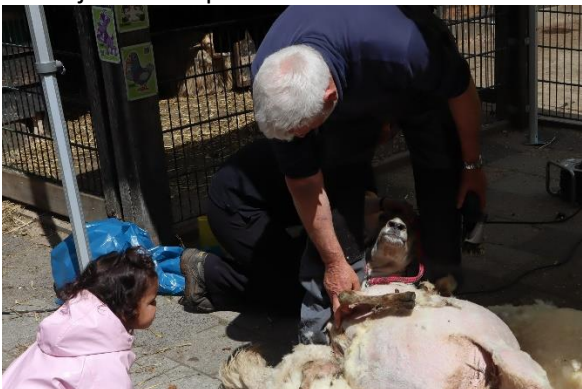
De hele dag zijn er belangstellende kijkers, hier bij het scheren van 'n schaap met lichtere vacht