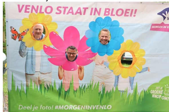
Het team van Morgen in Venlo verwelkomt je bij de volgende stop.