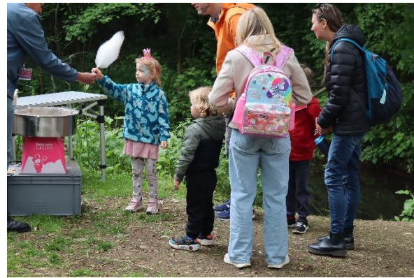
Ook kun je meer over het verduurzamen van je huis te weten komen en smullen van een lekkere suikerspin van Fairtrade rietsuiker