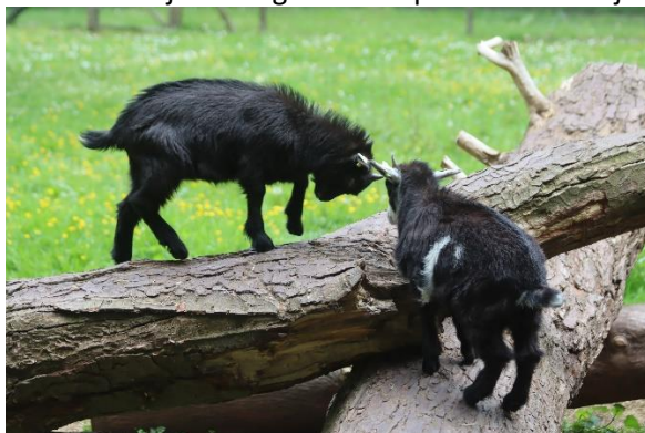
De jonge geitjes stoeien er lustig op los