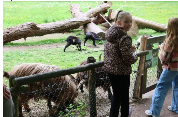
Bij het volgende infopunt 'dier' kun je de geitjes bewonderen, aaien en voeren