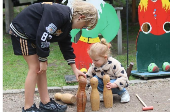
Waar kinderen hun hart ophalen