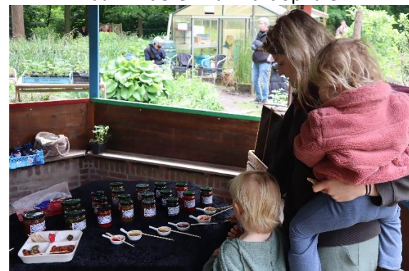
Die kun je eerst proeven in het prieeltje met op de achtergrond de Hagerhof moestuin