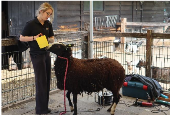
Het zwarte schaap met volle vacht eet eerst nog lekkere brokjes voor zijn scheerbeurt