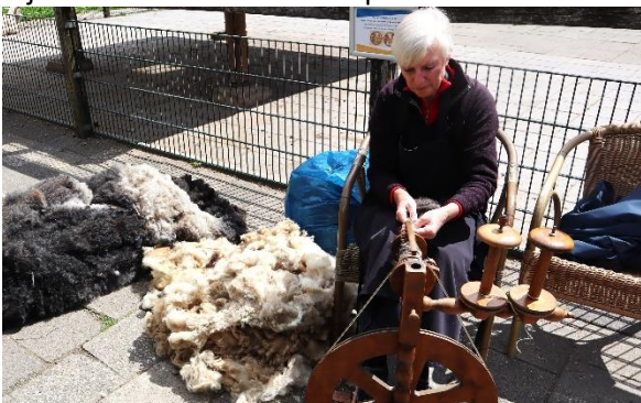
Ze dienen als grondstof voor de spinster, die er met haar spinnewiel wollen draden van spint