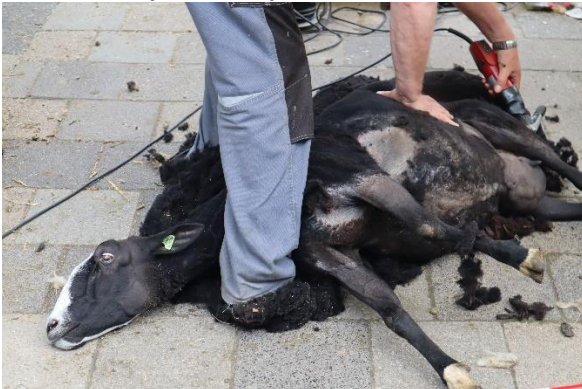
Dat doet hij vakkundig en geroutineerd en snijdt daarbij het schaap niet