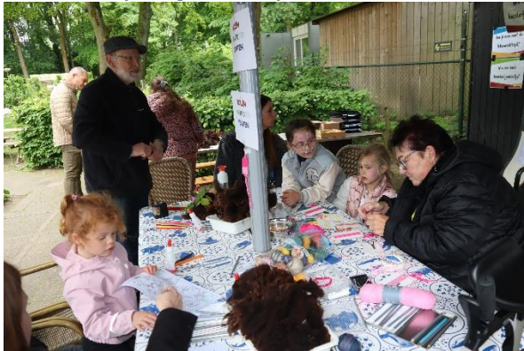
De hele dag volgen kinderen het goeie voorbeeld