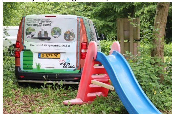
Er wordt zichtbaar gemaakt wat het effect is als je beter met regenwaterafvoer omgaat. De watercoach legt uit hoe je dat kunt doen.