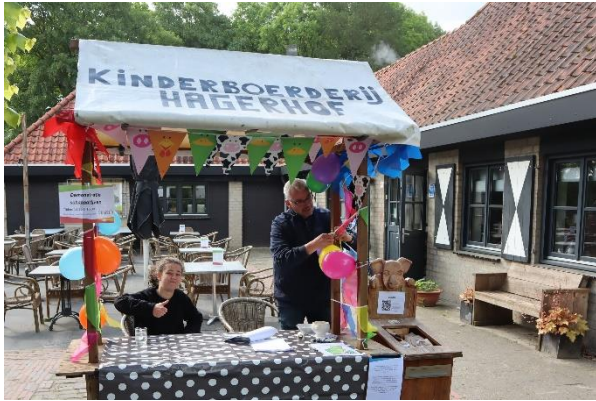
De vrijwilligers bij het infopunt en voederzakjes verkoop bij de ingang zitten er klaar voor.