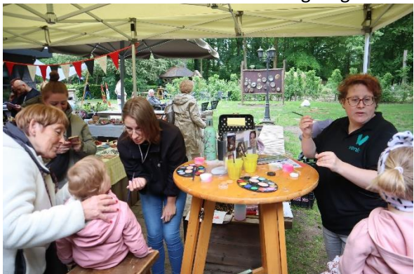
Vrijwilligers van de Kinderboerderij schminken non stop kinderen, die mogen aangeven met welke kleur of motief