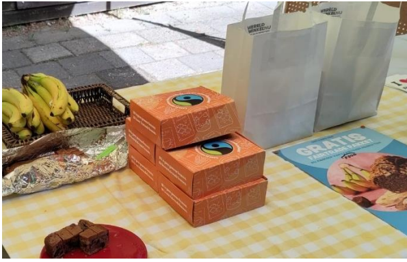
De aanbieding in het kader van de Fairtrade weken (4 t/m 17 mei) valt in de smaak net als het bananencake zelf. De twee in proefstukjes verdeelde cakes gaan schoon op.