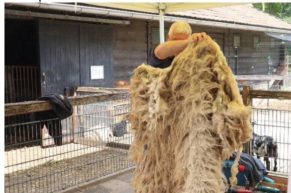
De vachten blijven grotendeels aan één stuk aan elkaar