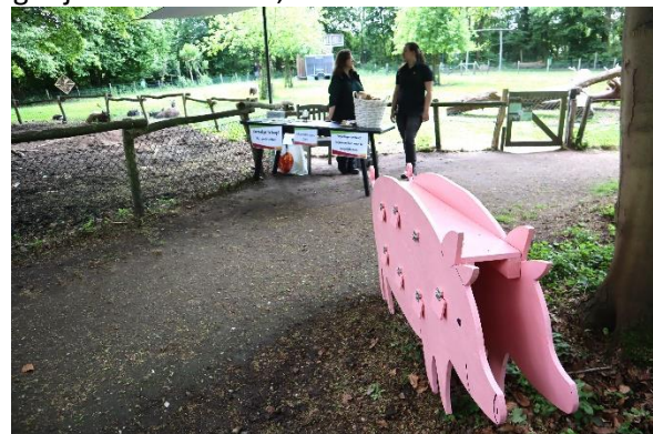
Ook is er een kunstvarken met kijkgaten