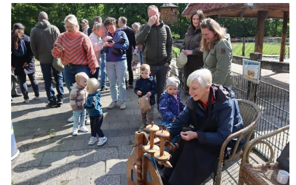
Ook dit alles de hele dag onder belangstellend oog van de vele kinderen en hun ouders