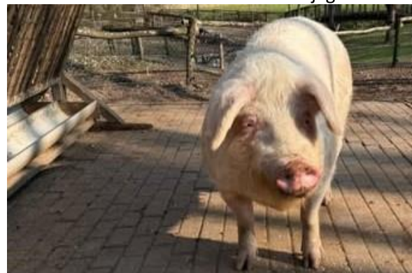
Verderop de enige echte Miep, die onlangs verhuisd is naar een nieuw plekkie, waar ze lekker de hele dag kan wroeten, spelen en genieten zoals een echt varken dat hoort te doen