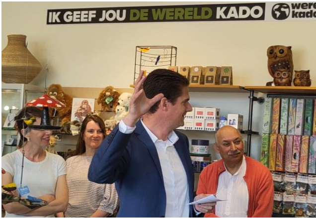
Foto-impressie opening Wereldwinkel Gilze en Rijen 10 mei 2024