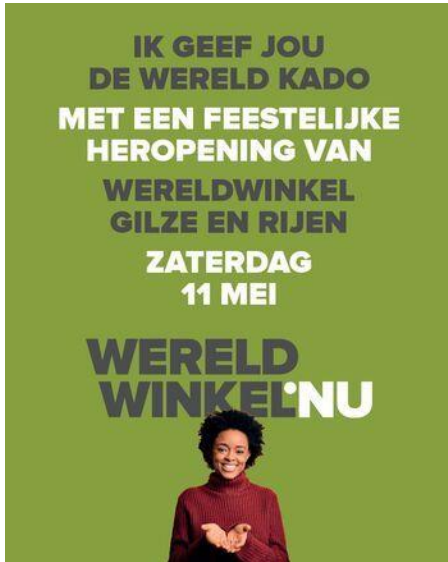
Foto-impressie opening Wereldwinkel Gilze en Rijen 10 mei 2024