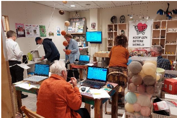
Foto-impressie kassa project Wereldwinkel Venlo 2024